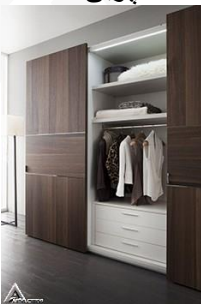
کمد چوبی R09