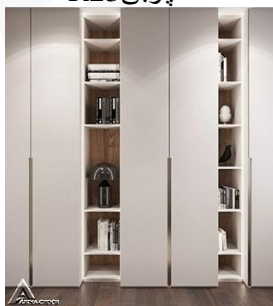
کمد چوبی R24