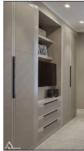
کمد چوبی R36