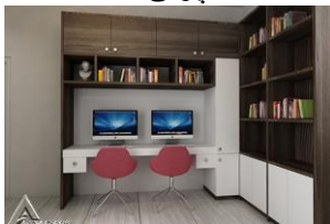
کمد چوبی R34