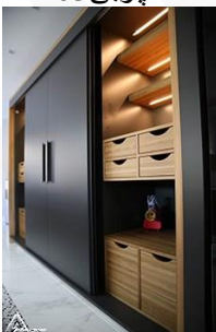
کمد چوبی R04