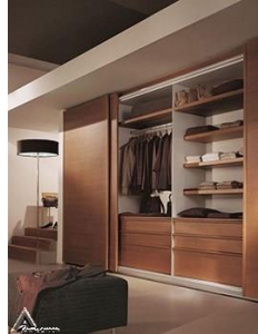
کمد چوبی R18