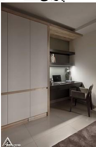
کمد چوبی R05