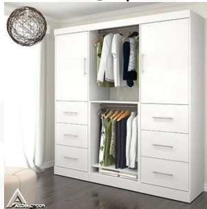
کمد چوبی R28