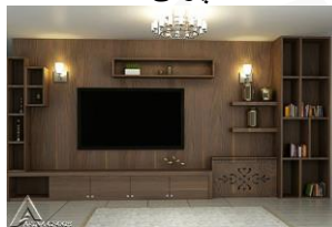
کمد چوبی R37