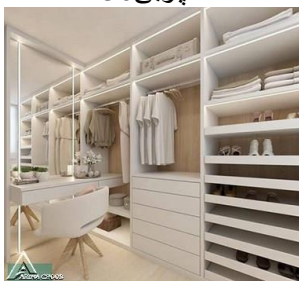
کمد چوبی R31