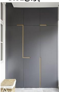
کمد چوبی R03