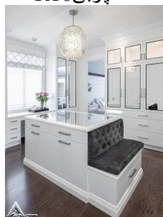
کمد چوبی R11