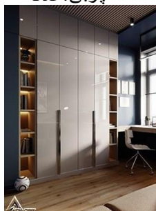
کمد چوبی R15