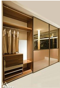
کمد چوبی R10