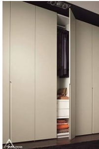
کمد چوبی R06