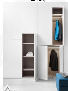
کمد چوبی R12