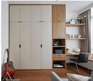
کمد چوبی R33