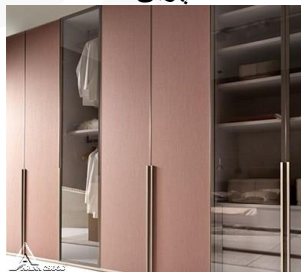
کمد چوبی R29