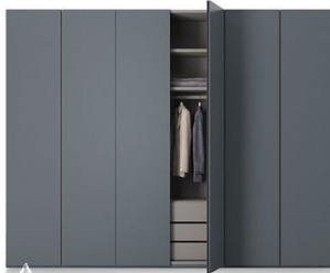
کمد چوبی R30