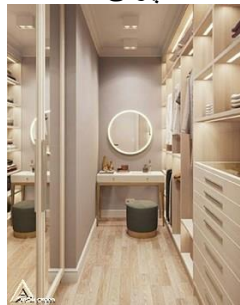
کمد چوبی R19