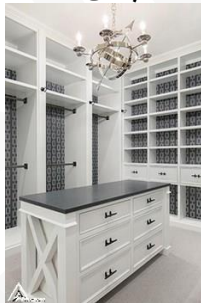
کمد چوبی R08