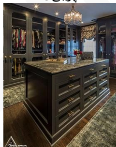
کمد چوبی R16