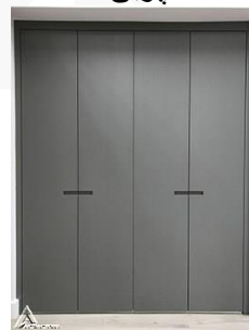
کمد چوبی R13