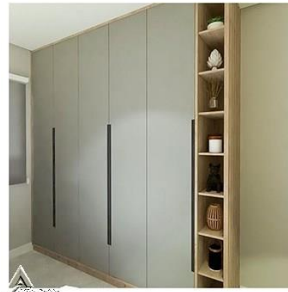
کمد چوبی R27