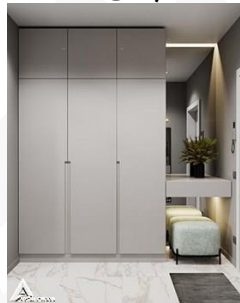
کمد چوبی R20