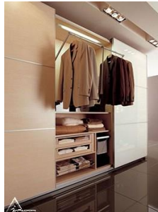
کمد چوبی R14