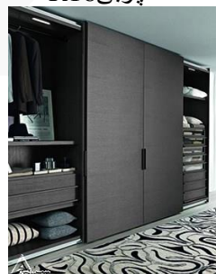
کمد چوبی R17