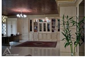
کمد چوبی R35