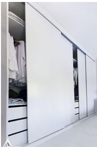
کمد چوبی R02