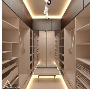
کمد چوبی R25