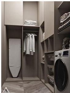
کمد چوبی R21