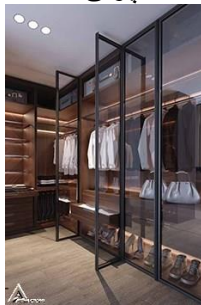
کمد چوبی R07