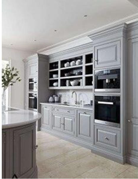
○ ○ کابینت کلاسیک K12