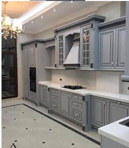
کابینت کلاسیک K06