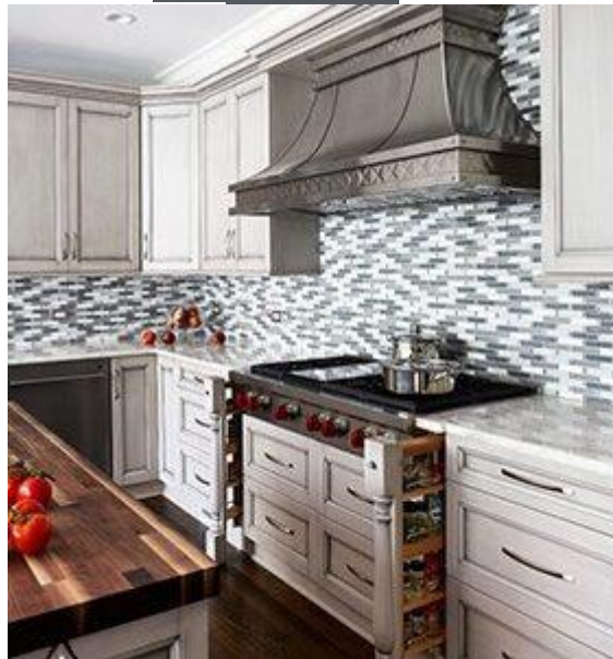
کابینت کلاسیک K08