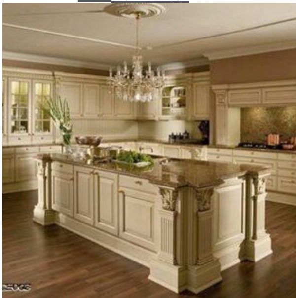
کابینت کلاسیک K04