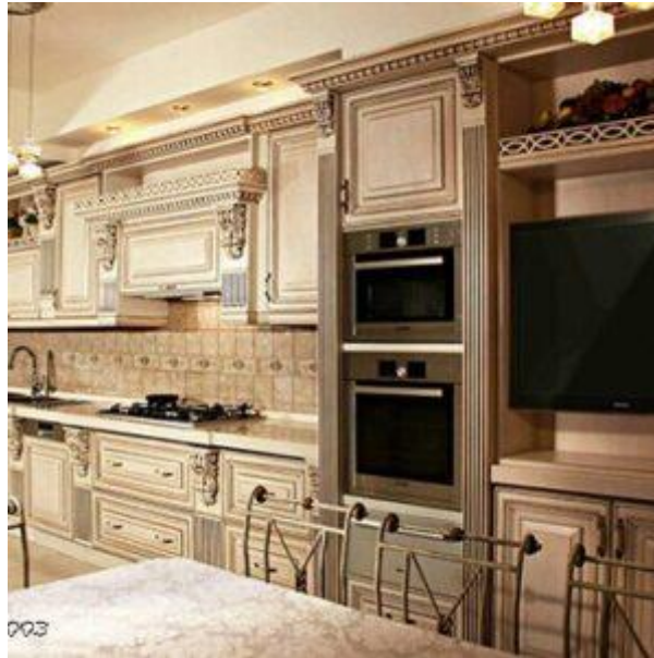
○ ○ کابینت کلاسیک K02