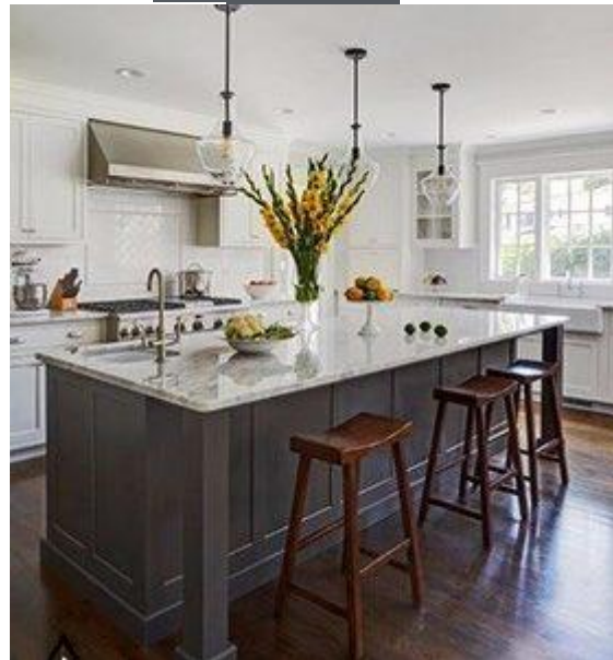
کابینت کلاسیک K10