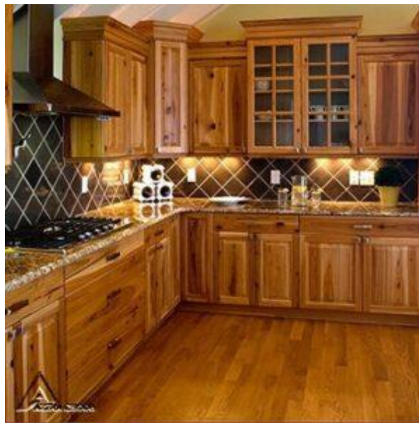
کابینت کلاسیک کد K01

یکی از انواع کابینت ها که در طراحی داخلی سبک جدیدی را ایجاد کرده اند کابینت های به سبک کلاسیک هستند. این نوع کابینت از پرطرفدارترین و محبوب ترین نوع کابینت آشپزخانه هستند که امروزه بسیار مورد توجه اند. جنس این نوع از کارها چوبی و درب های آن برجسته و روی آنها حکاکی های زیادی انجام شده است. به لحاظ ظاهری این نوع کابینت نمایی سلطنتی دارند و روی دستگیره های فلزی آن نقش و نگاری برجسته طراحی شده است. استفاده از کابینت کلاسیک، فضایی نوستالژیک به دکوراسیون منزل داده و تداعی کننده یک آشپزخانه ی تمام چوب و کلاسیک می باشد. که هم قابلیت اجرا در فضای کوچک و هم بزرگ را دارد و به دلیل جا سازی زیادی که دارد فضای بیشتری را در اختیار کاربر قرار می دهد. به دلیل طرحی که دارد یک فضای لوکس را برای منزل فراهم می کند و علاوه بر کاربردی بودن جنبه تزئینی خاصی نیز دارد.