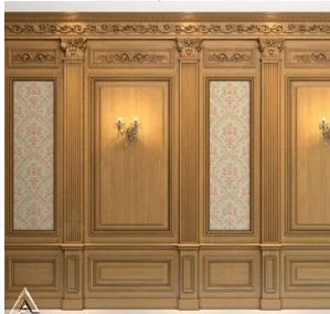
دیوار کوب چوبی S12