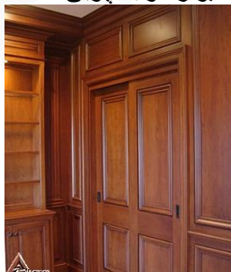
دیوار کوب چوبی S17