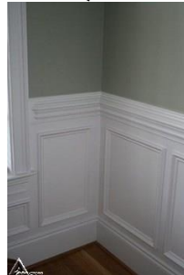
دیوار کوب چوبی S34