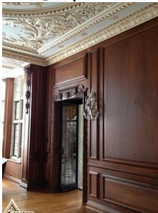
دیوار کوب چوبی S27