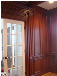
دیوار کوب چوبی S18