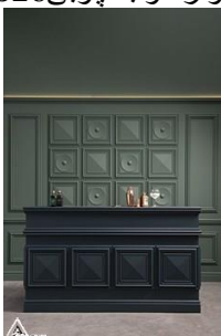
دیوار کوب چوبی S27