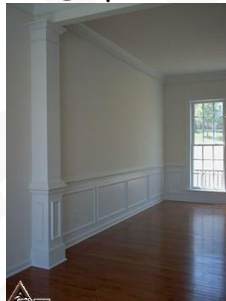
دیوار کوب چوبی S31