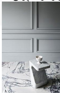
دیوار کوب چوبی S21