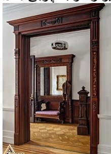
دیوار کوب چوبی S20