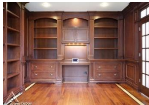
دیوار کوب چوبی S05