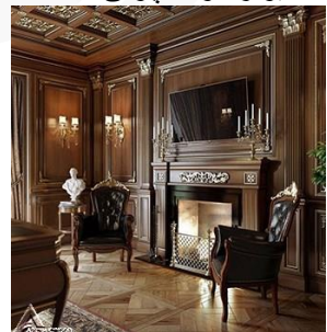
دیوار کوب چوبی S13