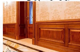
دیوار کوب چوبی S02