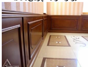
دیوار کوب چوبی S07