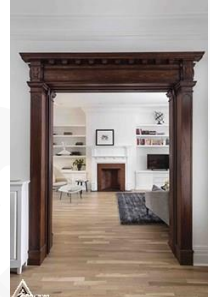
دیوار کوب چوبی S24