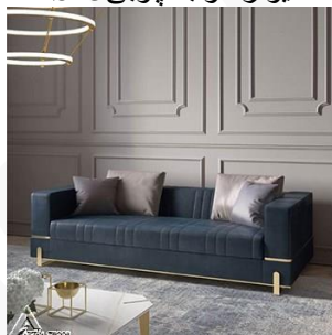
دیوار کوب چوبی S16