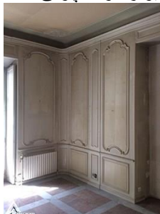
دیوار کوب چوبی S15