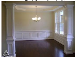
دیوار کوب چوبی S06