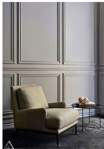
دیوار کوب چوبی S22