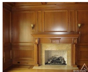
دیوار کوب چوبی S09

از آنجایی که تزئین دیوارها می تواند تاثیر قابل ملاحظه ای بر روی تغییر فضا بگذارد، دیوارکوب ها نیز پای خود را به طراحی داخلی باز کردند. دیوارکوب ها در انواع مختلف و با متریال های متفاوت در بازار موجودند اما یکی محبوب ترین و پرطرفدارترین متریال ها، چوب است.