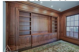
دیوار کوب چوبی S04