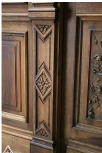
دیوار کوب چوبی S14