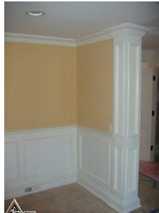
دیوار کوب چوبی S33