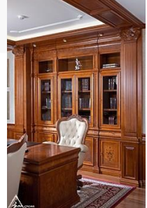
دیوار کوب چوبی S25