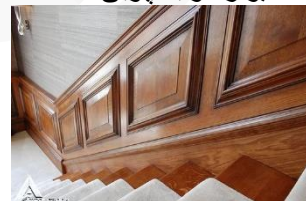
دیوار کوب چوبی S03