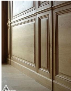
دیوار کوب چوبی S29