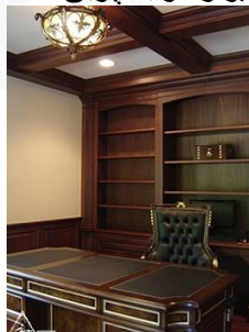
دیوار کوب چوبی S32