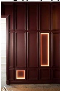
دیوار کوب چوبی S28