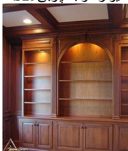
دیوار کوب چوبی S30