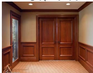
دیوار کوب چوبی S08