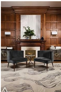
دیوار کوب چوبی S26