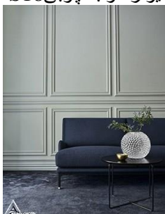
دیوار کوب چوبی S19